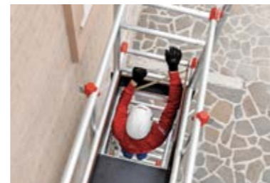
Accesso all'area di lavoro completamente protetta, grazie ai parapetti montati dal basso. Totally safe access to the working area, thanks to the assembly from below of the guard-rail frames.