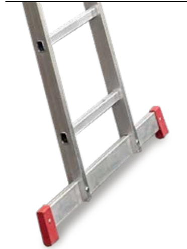
Base stabilizzatrice di serie dal modello T350/1 Standard stabiliser base from model T350/1

50.000 cicli/cycles USO PROFESSIONALE PROFESSIONAL USE