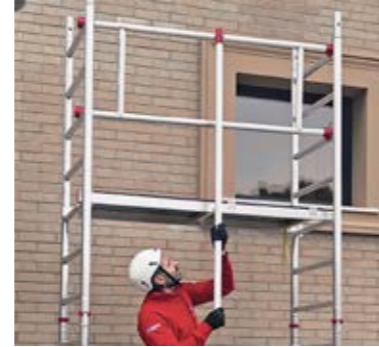
Nuovo sistema di montaggio in sicurezza dei parapetti. New safe assembly system of the guard-rails frames.