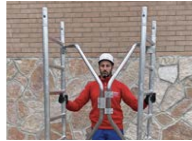
Base con kit richiudibile standard. Base with folding kit.