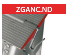
Gancio per secchio Bucket hanger