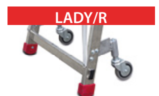
RUOTE retrattili più barra rigida. Retractable wheels and rigid bar.