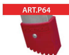
Kit tappi ND/NDL (4pz). Kit with 4 feet for ND/NDL.