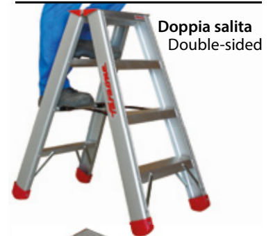
Doppia salita Double-sided

50.000 cicli/cycles USO PROFESSIONALE PROFESSIONAL USE