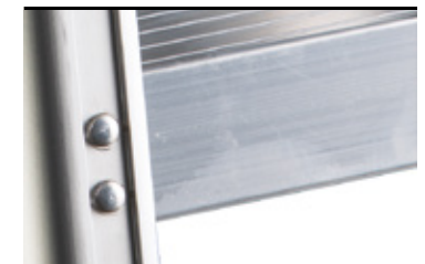
Fissaggio gradini con tecnologia aeronautica. Step fastening system with aviation technology

SU OGNI PRODOTTO VENGONO RIPORTATE LE INFORMAZIONI RICHIESTE DAL D.L. 81 ALLEGATO XX THE INFORMATION REQUESTED BY L.D. 81 ART. XX ARE AVAILABLE ON EACH PRODUCT