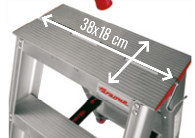
Piano superiore con cerniera in monoblocco di alluminio fresato. Split top step in milled aluminium.