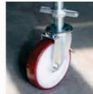
COD. 8.00 EURO 72 cad./cha.

Hoch-stabiles Rad, Ø 200, mit Höhenverstellung und Druck-Bremse. 4 St. für Rollgerüst. Abzüglich 50,00 Euro pro Rad Cod. 9.00, serienmäßig inbegriffen. Roues Ø 200 très résistante avec régulateur de hauteur et frein sous pression, 4 pièces par échafaudage mobile. À déduire 50,00 euros par roue Code 9.00 en équipement de série.