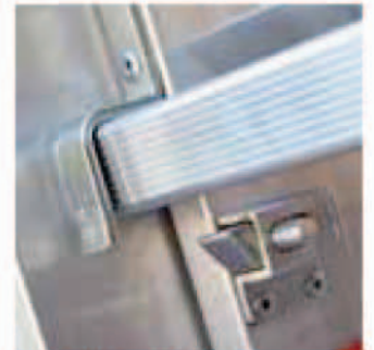
Spezielle Aushaksicherung Anti-décrochage spécial