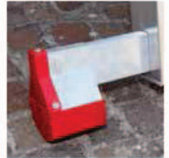
Neuer Stabilisierholm Nouvelle base stabilisatrice