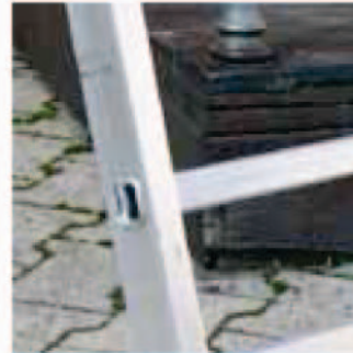
Stufe 30x30 mm Marche 30x30 mm