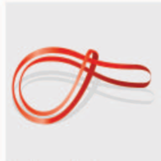
Verankerungsband Ceinture pour ancrage