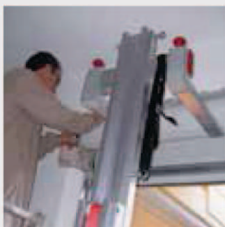
Montage von Rollläden. Montage de volets.