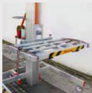
Ausrichtbare Rollen für Lager. Rouleaux orientables pour entrepôts.