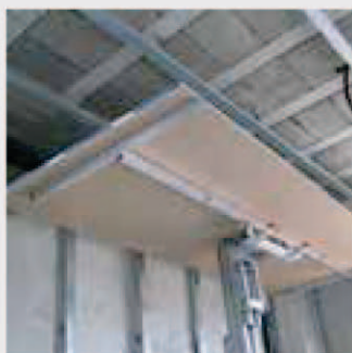
Montage von Rigipspaneelen. Montage de panneaux en placoplâtre.